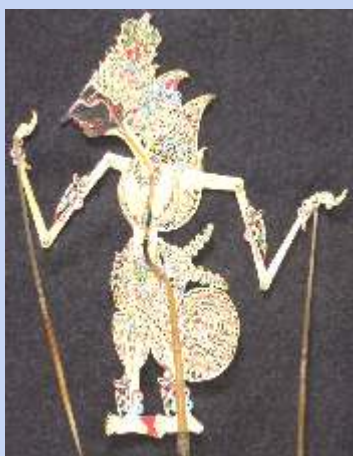
インドネシアのドゥワラティ王国 の王様 「プラグ・クレスナ」