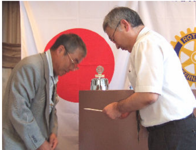
どうもありがとうございました