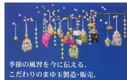
季節の風習を今に伝える、こだわりのまゆ玉製造・販売。