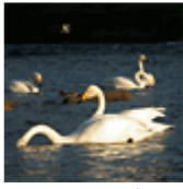
下田にも冬の使者が