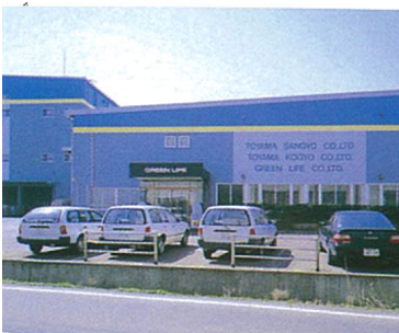
(株)グリーンライフ