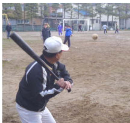
石川バッティングコーチ