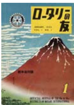
創刊号 1953年 1月号

ということで今回の紙面卓話では「ロータリーの友」は全く開かず仕舞いでした(苦笑)。次回R雑誌月間についてスピーチの機会を与えていただける時があるとしたら、それまでにはロータリアンとして、この「ロータリーの友」が面白く読めるまで成長したいと思っております。ありがとうございました。