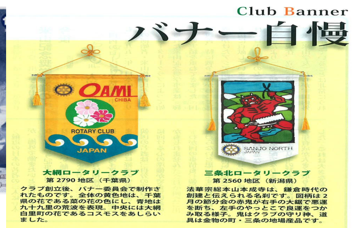
大網ロータリークラブ 第2790地区(千葉県) クラブ創立後、バナー委員会で作成されたものです。全体の黄色地は、千葉県の花である菜の花の色にし、青地は九十九里の荒波を表現。中央には大網白里町の花であるコスモスをあしらいました。