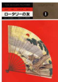
1987年1月号 国際ロータリー公式雑誌に