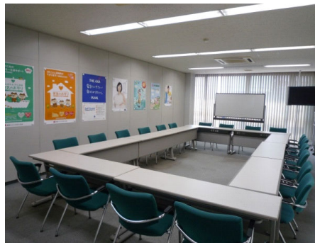
■自社のセミナー室