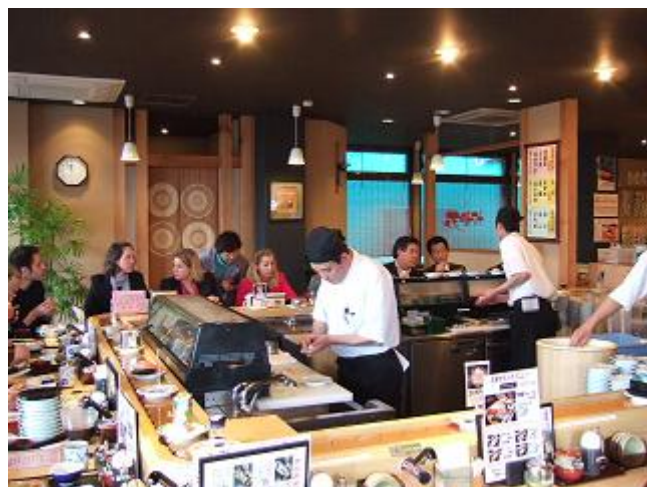
「花時計」さんでは回転寿司に興味津々