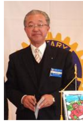
石川友意会員 マルチプル（2回）