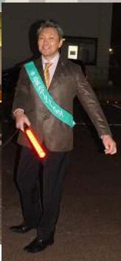
外の駐車場 誘導 お疲れ様 です