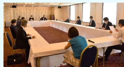
例会会場で席の間隔を広くとり開催