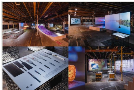
『Red Dot Design Award 2022』ブランド&コミュニケーションデザイン部門 グランプリ

2022年ドイツの「Red Dot Design Award (レッド・ドットデザイン賞)」をいただき注目され、今ではドイツの方の見学コースの1つに入っているという実績があります。